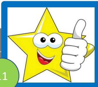
Lelei tele! Mālō lava! Na ‘o sina talanoa pu’upu’u.