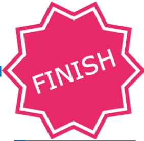
Ua uma! Taimi e ō ai i le fale.

Pe ‘a ‘e fa’alogo loa i se leo tu’u le pine i luga o le laupapa....po’o le tagata i totonu o le va’a.