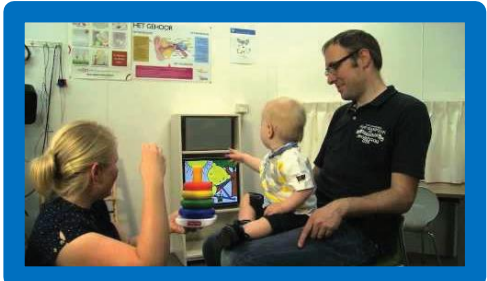
Fa’asaga ma tilotilo mo le papeti po’o le vītiō.